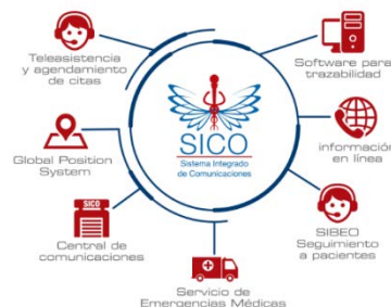
Gráfica No.1 Modelo de Atención SICO.